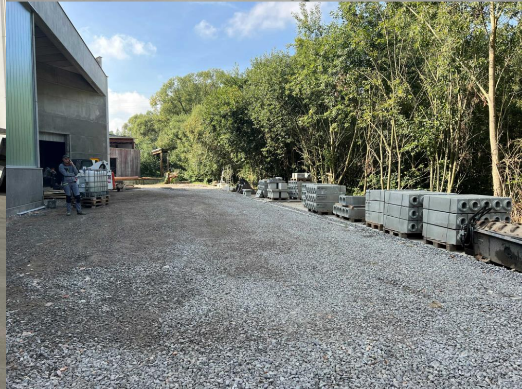
Rozšiřování výrobního závodu v Boršově, montážní práce a budování cesty ve výrobním závodě v Brtnici