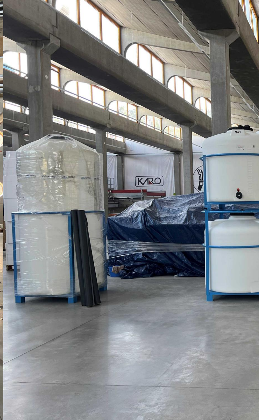
Montážní práce ve výrobním závodě v Brtnici